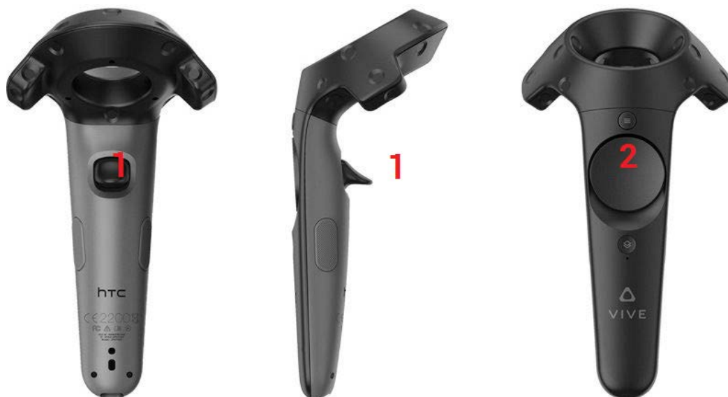
Рисунок. управление HTC VIVE.

При использовании системы формирования виртуальной реальности HTC VIVE управление производится при помощи соответствующих устройств ввода.